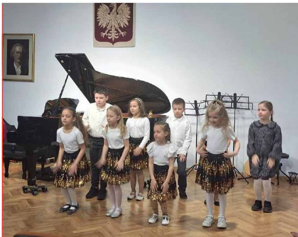
Szkoła muzyczna tętni życiem s. 3