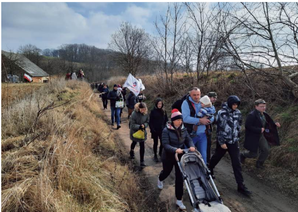
Bieg Tropem Wilczym w Królowem i Kietrze